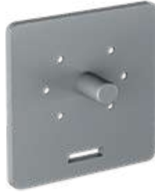
Çelik Pimli Motor Bağlantı Parçası Steel Pinned Motor Connection Part