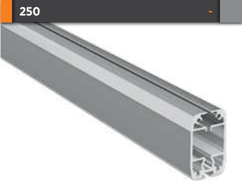
Kanat Profili Wing Profile