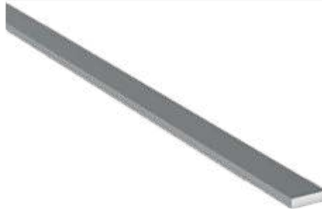
5x20 Lama Demir 5x20 Blade Iron