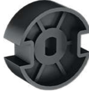
Rotor Aktarma Parçası Rotor Transmission Part