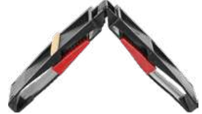
28 mm Ayarlı Cam Takozu 28 mm Adjustable Glass Wedge