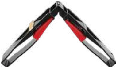
18 mm Ayarlı Cam Takozu 18 mm Adjustable Glass Wedge