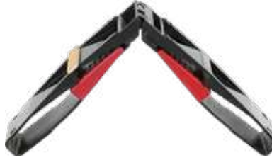
24 mm Ayarlı Cam Takozu 24 mm Adjustable Glass Wedge