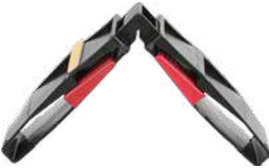
32 mm Ayarlı Cam Takozu 32 mm Adjustable Glass Wedge