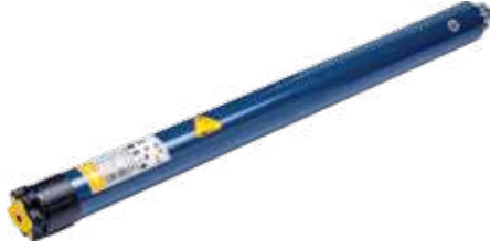
Zip Motor (20 Nm) Engine (20 Nm)