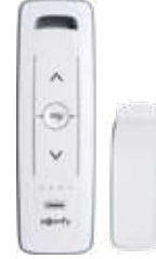
Kumanda (Çoklu) Engine Remote Control (Multi)