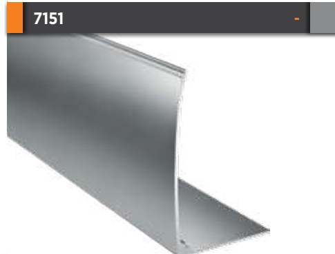
7151 Üst Kasa Kapak Profili Upper Case Cover Profile Gramajı Weight 1,475 kg/m