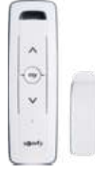
Kumanda (Tekli) Engine Remote Control (Mono)