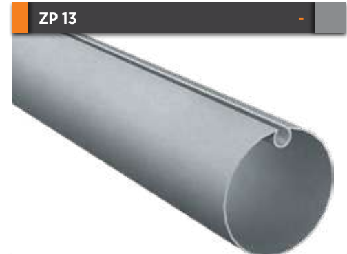
ZP 13 Sac Tambur Borusu Sheet Drum Tube Gramajı Weight 2,110 kg/m