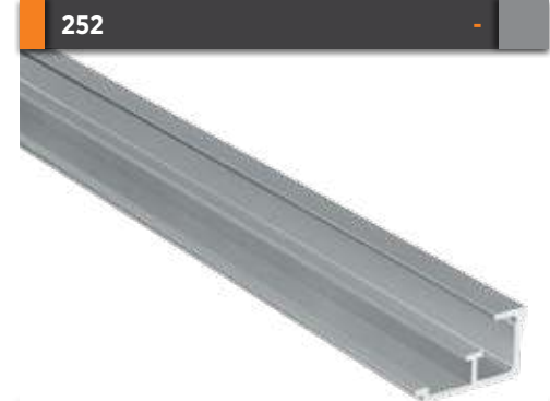
252 Yan Kasa Kapak Profili Side Case Cover Profile Gramajı Weight 0,313 kg/m