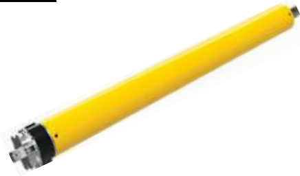
Zip Motor (20 Nm) Engine (20 Nm)