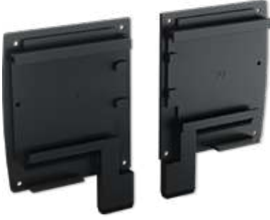
Üst Kasa Kapak - Sağ/Sol Upper Case Cover - Right/Left