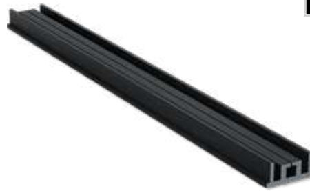
Fermuar Aparatı Zipper Apparatus