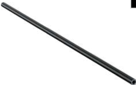
Perde Plastiği Curtain Plastic