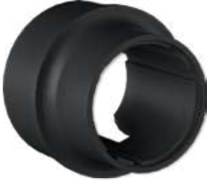
Motorlu Tambur Bağlantı Motorized Drum Connection