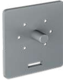
Çelik Pimli Motor Bağlantı Parçası Steel Pinned Motor Connection Part