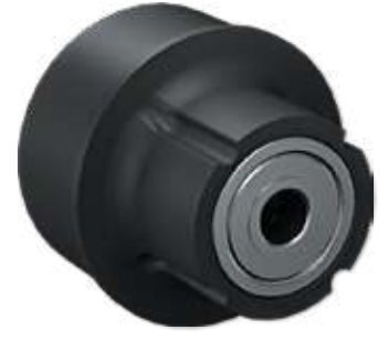
Rulmanlı Tambur Bağlantı Bearing Drum Connection