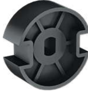
Rotor Aktarma Parçası Rotor Transmission Part