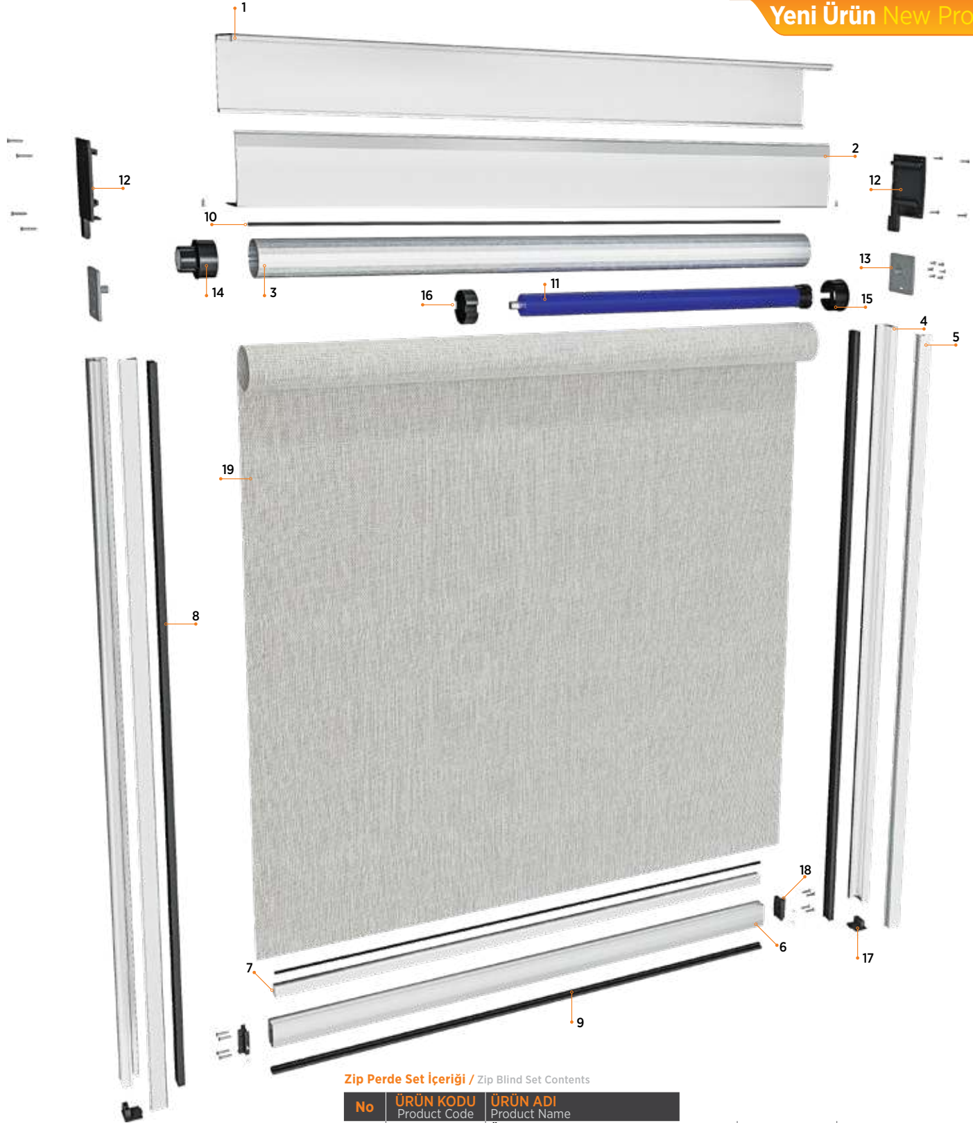
Zip Perde Set İçeriği / Zip Blind Set Contents