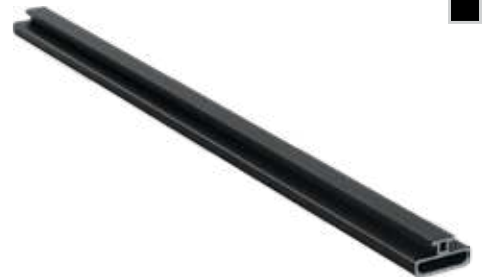
Kanat Contası Wing Seal