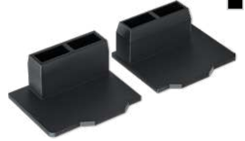
Yan Kasa Kapakları - Sağ/Sol Side Case Covers - Right/Left