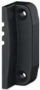
Kanat Kapak Wing Cover