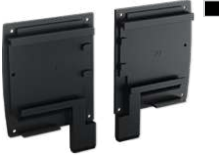
Üst Kasa Kapak - Sağ/Sol Upper Case Cover - Right/Left