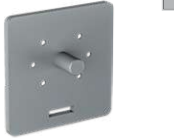
Çelik Pimli Motor Bağlantı Parçası Steel Pinned Motor Connection Part