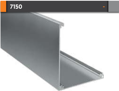
7150 Üst Kasa Profili Upper Case Profile Paket İçi Adet Quantity Per Package 2 Gramajı Weight 1,776 kg/m