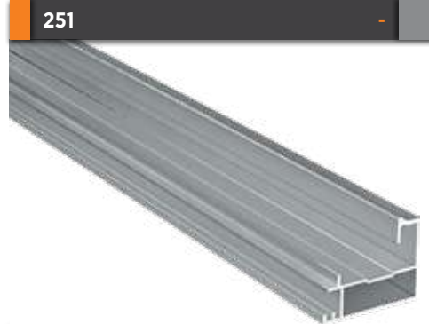
251 Yan Kasa Profili Side Case Profile Paket İçi Adet Quantity Per Package 6 Gramajı Weight 0,572 kg/m