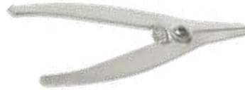
Adjustable Glass Wedge Holder